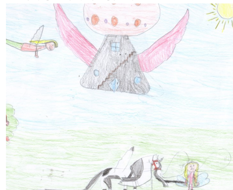
dessin de Violaine

PLANNING: à retrouver sur http://trottelavivelle.ffe.com/File/Planning_2012.pdf